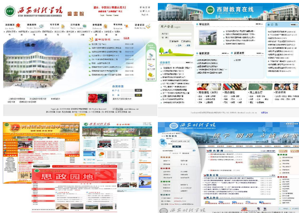
图表 10：校园网服务本科教学

（4）外语学习平台。学校拥有教育部推荐的基于计算机和网络的“大学英语”教学软件系统，即外语教学与研究出版社的“新视野大学英语”教学系统和上海外语教育出版社的“新理念大学英语”教学系统软件。在保证大学英语、英语专业和日语专业的正常应用的基础上，也为学生课下的自主学习提供了便利的条件，特别是对大学英语网络试点班教学提供了有力的保障。