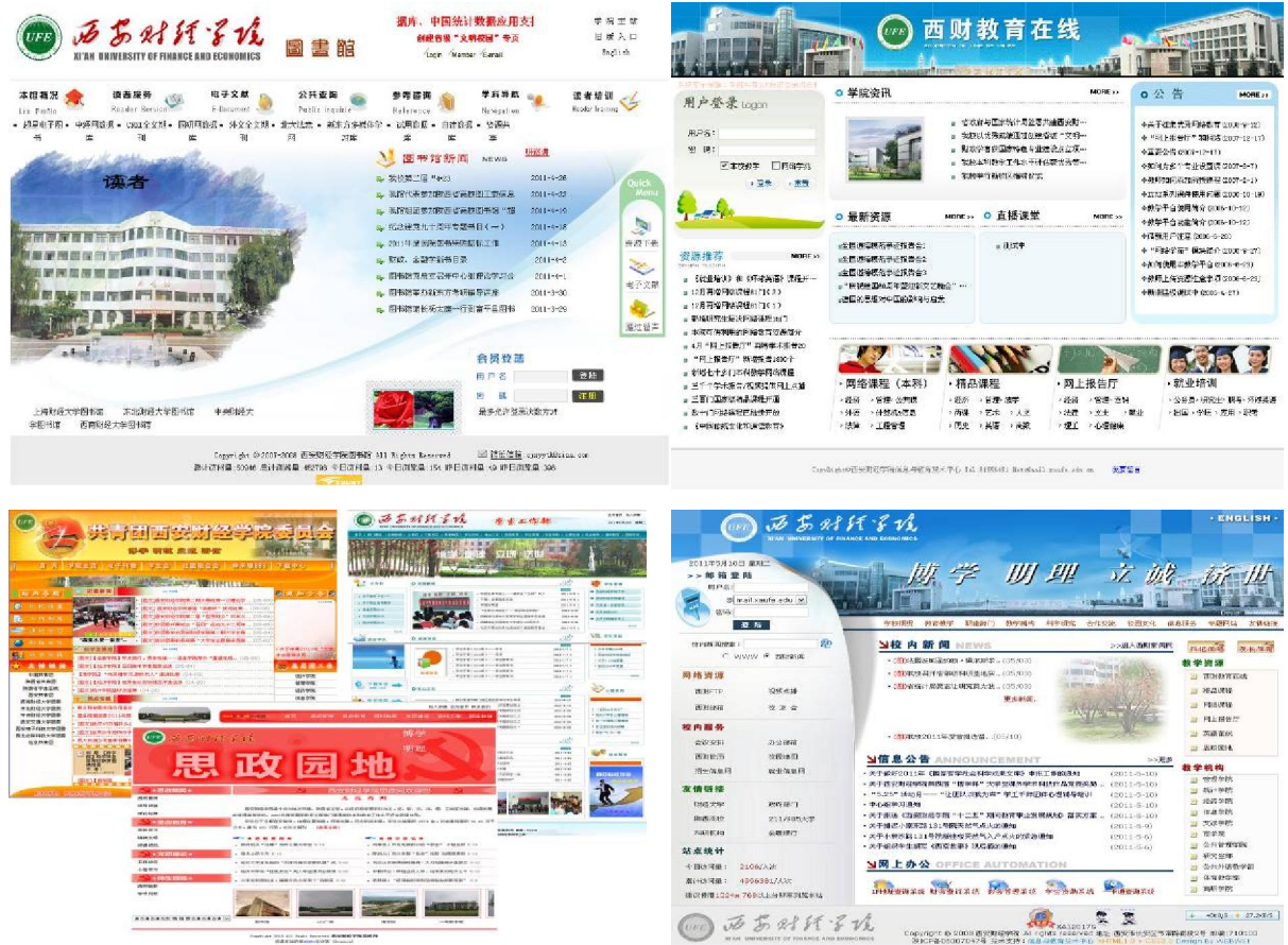
图4：校园网服务本科教学

网接入多媒体网络教室、实验室（实训中心），满足了全校计算机网络课程教学及各专业实践教学需要；基于校园网络，校园一卡通、校园广播、校园安防等系统为我校教学、科研、管理工作提供了良好的信息化平台。